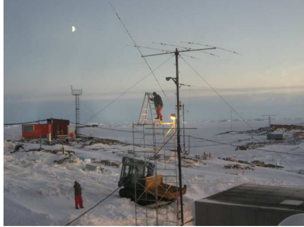
写真1：極夜のアンテナ修復作業

昭和基地は遂に5月31日より太陽の昇らない極夜に入ってしまいました。7月12日までの40日間です。太陽の昇らないと言っても昼頃は短時間ですが、太陽の反射により薄明かりになり、外作業が行えます。早速、先日のC級ブリザードで曲げられた八木アンテナの修復が、設営隊員にお願いして行われました。こ