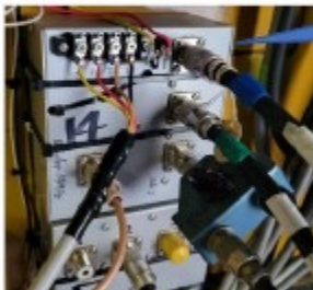
同軸スプリッタ・切替器

8N8HQ フルスケールHAMクラブ : JR8VSE, JH8SLS, JE8KX, JR8LRQ