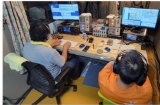
オペレーション風景(KX&SLS)