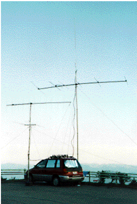
JF2VAX/2 電信電話シングルオペマルチバンド 東海地区 1位