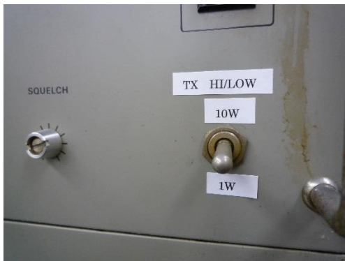
電力切替スイッチを 1W に切替える