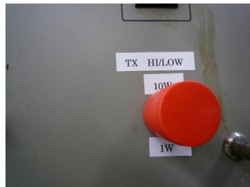
スイッチガードをエポキシ接着剤等で固着